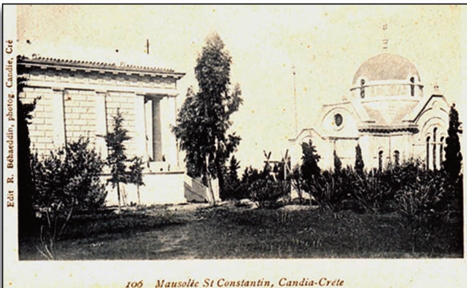
106 Mausolée St Constantin, Candia-Crète