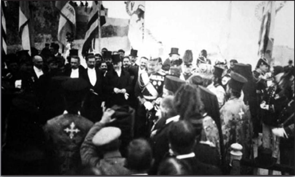
13. Η τελετή της ένωσης της Κρήτης με την Ελλάδα (1 Δεκεμβρίου 1913). Ανάμεσα στους επισήμους διακρίνονται ο Ελευθέριος Βενιζέλος και ο βασιλιάς Κωνσταντίνος.