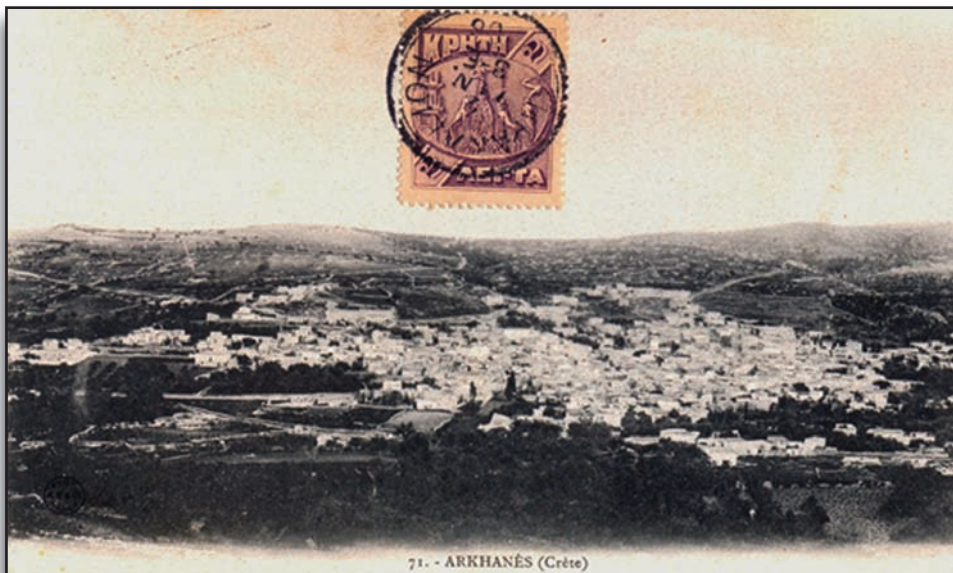
10. Οι Αρχάνες την εποχή που τις επισκεπτόταν ο Καζαντζάκης.