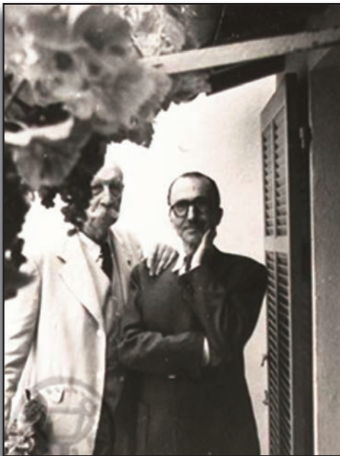
14. Νίκος Καζαντζάκης και πρίγκιπας Γεώργιος, ύπατος αρμοστής της Κρητικής Πολιτείας (1898-1906). Και οι δύο συνδέονταν με φιλία και ο συγγραφέας αφιέρωσε τον Τελευταίο Πειρασμό στη σύζυγο του Πρίγκιπα Μαρία Βοναπάρτη, Antibes, 1955.