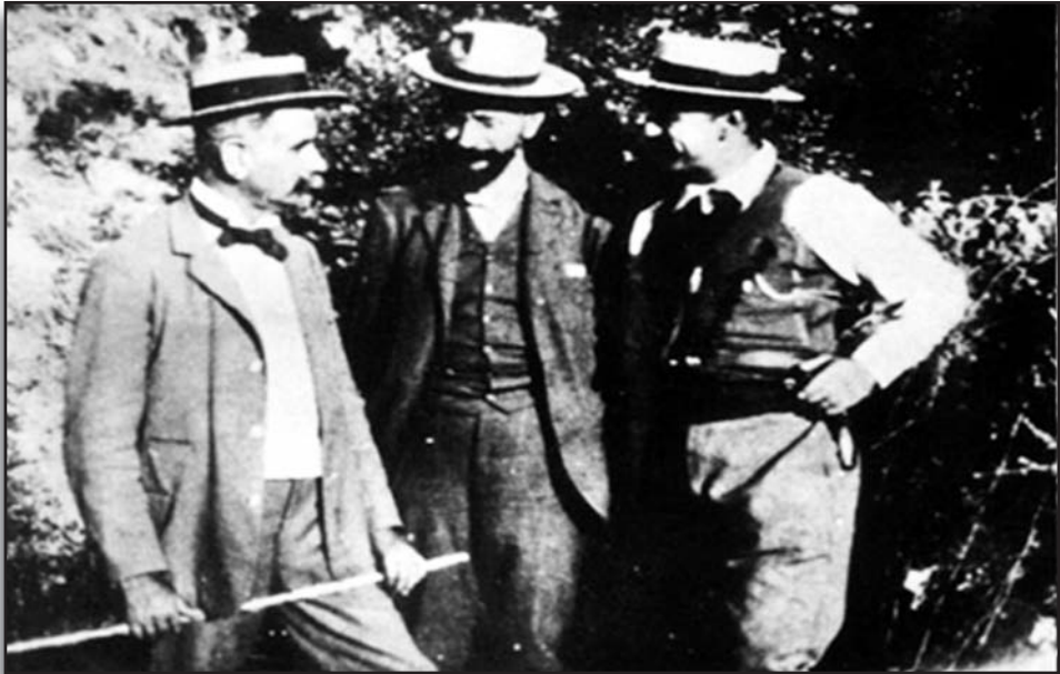
9. Οι πρωτεργάτες της Επανάστασης του Θερίσου Βενιζέλος, Φούμης, Μάνος (1905), στους οποίους και αναφέρεται ο Καζαντζάκης.