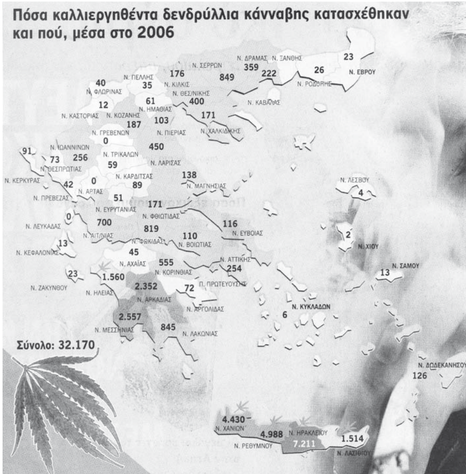
Γράφημα: Δενδρύλλια κάνναβης που κατασχέθηκαν σε νομούς της Ελλάδας κατά το έτος 2006. Πηγή: εφημερίδα 'Η Καθημερινή' 18-11-2007