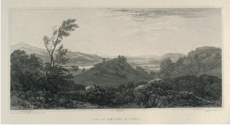
Εικόνα 5 : Τοπίο της κοιλάδας της Ολυμπίας (Stanhope 1824-βλ. Χατζή-Σπηλιοπούλου 2012, 80)

ήταν εικοσιτέσσερα κομμάτια μετοπών, τα οποία μεταφέρθηκαν στη Γαλλία και εκτέθηκαν στο Μουσείο του Λούβρου. 58 Οι συστηματικές ανασκαφικές επιχειρήσεις που άρχισαν το 1875 από το –τότε Αυτοκρατορικό– Γερμανικό Αρχαιολογικό Ινστιτούτο 59 ήταν πρότυπες για την εποχή. Έφεραν έναν αέρα αλλαγής στην αρχαιολογία, καθώς οι ανασκαφείς παραιτήθηκαν από την εκμετάλλευση των αρχαιοτήτων και δέχθηκαν την έκθεση των ευρημάτων σε Μουσείο που ανεγέρθηκε πολύ κοντά στο Ιερό. 60 Η Ολυμπία ανέκτησε τη θέση της στη συνείδηση του πνευματικού κόσμου, ειδικά του αρχαιολογικού κοινού. Επιπλέον, πολυάριθμες εκθέσεις από τότε μέχρι σήμερα, ως την έκθεση που εγκαινιάστηκε στις 30 Αυγούστου 2012 στο Βερολίνο με τίτλο «Ολυμπία: Μύθος, Λατρεία και Αγώνες», 61