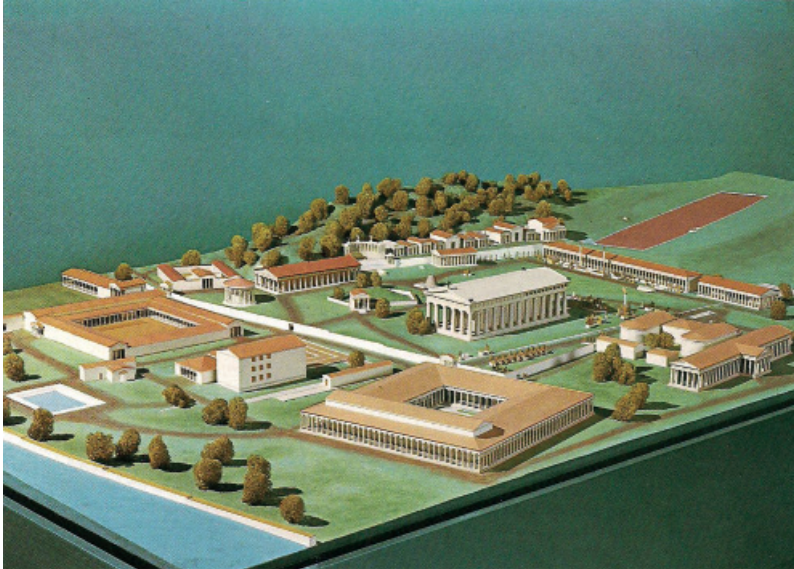
Εικόνα 2 : Γύψινη μακέτα με τα κυριότερα οικοδομήματα της Άλτης (Παπαχατζής 1979, 235, εικ. 210)

ματος του Δία, έργο του Φειδία, χτίστηκε δυτικά του ναού ειδικό εργαστήριο, το Εργαστήριο του Φειδία. Εκείνα τα χρόνια οικοδομήθηκαν ο Θεηκολεώνας (έδρα των Θεηκόλων, ιερέων της Ολυμπίας), οι Ζάνες (βάσεις δεκαέξι χάλκινων αγαλμάτων του Δία, στημένων από όσους αθλητές επιδίωξαν να νικήσουν με απάτη στους Ολυμπιακούς Αγώνες), Λουτρά («Βαλανεία» στην Εικ. 1), το Μητρώο (ο ναός της Μητέρας των Θεών), το Φιλιππείο, το Λεωνοδαίο (ξενώνας). Το Στάδιο μεταφέρθηκε ανατολικότερα των δύο αρχαϊκών, εκτός της Άλτης, όταν στα μέσα του 4ου αι. π.Χ. κατασκευάστηκε η Στοά της Ηχούς ή Επτάηχος (ονομασία που δήλωνε ότι μέσα σε αυτήν ο ήχος επαναλαμβανόταν επτά φορές) ή Ποικίλη (λόγω των τοιχογραφιών που κοσμούσαν το εσωτερικό της). Τότε περίπου ανεγέρθηκε και η Νότια Στοά που αποτέλεσε το νότιο σύνορο του ευρύτερου χώρου του Ιερού. Την ίδια εποχή το Ιερό διαχωρίστηκε από τα βοηθητικά και λαϊκά κτήρια με νέο μνημειακό πώρινο περίβολο με πέντε πύλες, τρεις στη δυτική πλευρά του και δύο στη νότια (Εικ. 1, 2, 3).