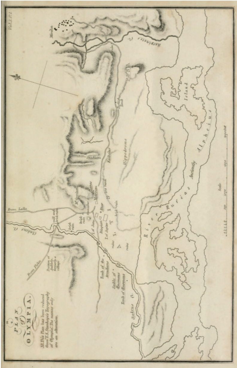
Εικόνα 4 : Αναδημοσίευση του σχεδίου της Ολυμπίας από το Stanhope 1824. Τα τοπωνύμια έχουν προστεθεί από τον Leake (1830, Vol. I, Pl. I)