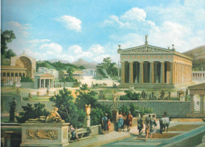
Εικόνα 3 : Υποθετική αναπαράσταση της Άλτης. Μόναχο, ιδιωτική συλλογή, 19ος αιώνας (Ημερολόγιο του 2013: Η Ολυμπία της Ευρώπης και του Κόσμου. Σ' Ε.Π.Κ.Α. Αρχαίας Ολυμπίας, Υπουργείο Πολιτισμού)

Από αυτή την εποχή ακμής του Ιερού και των Ολυμπιακών Αγώνων έχουν σωθεί οι δεκατέσσερις Ολυμπιονίκοι , δηλαδή επινίκιοι ύμνοι του λυρικού ποιητή Πινδάρου (520-443 π.Χ.), που ήταν αφιερωμένοι σε ονομαστούς Ολυμπιονίκες της εποχής του (παίδες και ενηλίκους, π.χ. τον Διαγόρα τον Ρόδιο, νικητή στην πυγμή το 464 π.Χ., αλλά και πολιτικούς, νικητές στους Αγώνες, λ.χ. τον Ιέρωνα, τύραννο των Συρακουσών, νικητή στην ιπποδρομία το 476 π.Χ.). Σε αυτούς τους εγκωμιαστικούς ύμνους δίνονται πληροφορίες για τον νικητή, το είδος της νίκης, το αγώνισμα, το γένος και την πατρίδα του. Τονίζεται το αξίωμα και οι αρετές του (η δύναμη, η τέχνη, η «σωφροσύνη», η ομορφιά), χάρη στις οποίες υπερίσχυσε των συναθλητών του. Επιπρόσθετα, η νίκη του ερμηνεύεται ως κατόρθωμα με θρησκευτικό, ηθικό, πνευματικό και ιδεολογικό περιεχόμενο· συσχετίζεται με αξίες που χαρακτηρίζουν την εποχή, την αντίληψη της ζωής και του κόσμου και δηλώνει την ποιότητα των αγώνων, έπαθλο