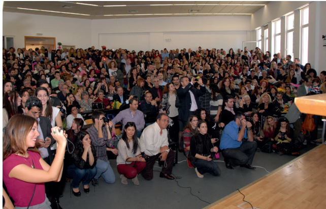
Τελετή αποφοίτησης, Νοέμβριος 2013.

Στις συγκεκριμένες αυτές, ασταθείς και αυταρχικές συνάφειες, εσείς επαναπροσδιορίστε εχθρούς και φίλους, επινοήστε καινούργια συνθήματα, βρείτε απαντήσεις εκεί όπου εμείς δεν καταφέραμε να βρούμε. Να ενημερώνεστε καλά και να παρεμβαίνετε, ως επιστήμονες αλλά και ως μέλη μιας σκεπτόμενης και διεκδικητικής κοινωνίας πολιτών: για τα αυτονόητα που παραβιάζονται ολοένα και πιο