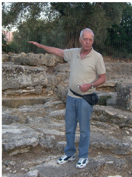
Εικ. 3 : Νησί Ελεύθερνας, Αύγ. 2009. Διδάσκοντας στον Μεγάλο Περίβολο

Το ανασκαφικό και επιστημονικό του έργο είχε μεγάλη διεθνή απήχηση και αναγνώριση. Ανήκε στην ομάδα των πρώτων καθηγητών ανασκαφών της Ελεύθερνας, όπου είχε από το 1985 μέχρι τη συνταξιοδότησή του την ευθύνη ενός από τους τρεις τομείς (Τομέας ΙΙ, Νησί και Πυργί). Παράλληλα, από το 1994 συνδιηύθυνε την ελληνογαλλική ανασκαφή στην Ίτανο, στην ανατολική Κρήτη.