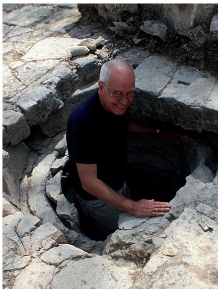
Εικ. 2 : Πυργί Ελεύθερνας, Αύγ. 2011. Μελετώντας τον θησαυρό του αρχαϊκού Ναού