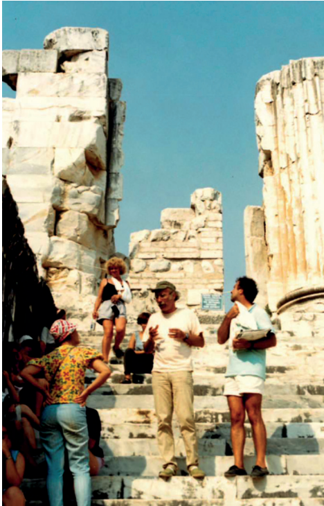
Εικ. 2 : Σε εκπαιδευτική εκδρομή του Τμήματος στη Μικρά Ασία

1974, επίσημα, μάλιστα, ως «μηδέποτε απομακρυνθείς», πριν αποχωρήσει οριστικά με δική του απόφαση από αυτήν. Ανασκαφικές εκθέσεις, μεθοδολογικές και άλλες σχετικές μελέτες του έχουν δημοσιευτεί, για παράδειγμα, στο Αρχαιολογικό Δελτίο , την Αρχαιολογική Εφημερίδα , τα Αρχαιολογικά Ανάλεκτα εξ Αθηνών , το Annual of the British School at Athens .