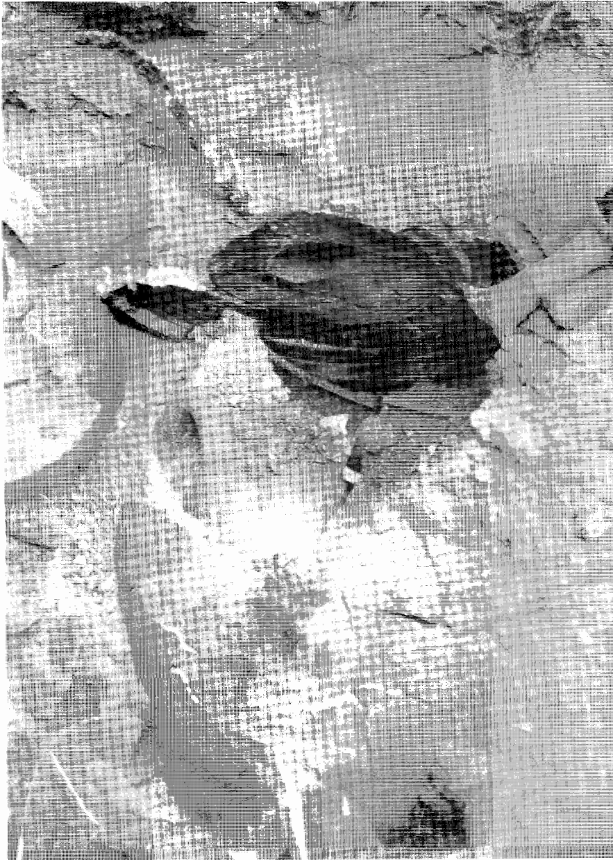
Εικ. 2. Τάφος A1/K1. Λεπτομέρεια της εικ. 1, μετά την απομάκρυνση του λίθου και τμήματος του χάλκινου αντικειμένου.

καθαρά (εικ. 2) ότι το χάλκινο αντικείμενο κάλυπτε αρχικά την κάλπη αριθμ. 143, ακουμπώντας στα χείλη της και μόνο η πτώση (;) του λίθου ή τα τμήματα της στέγης του τάφου προκάλεσαν την ελαφριά μετατόπισή του αντικειμένου.